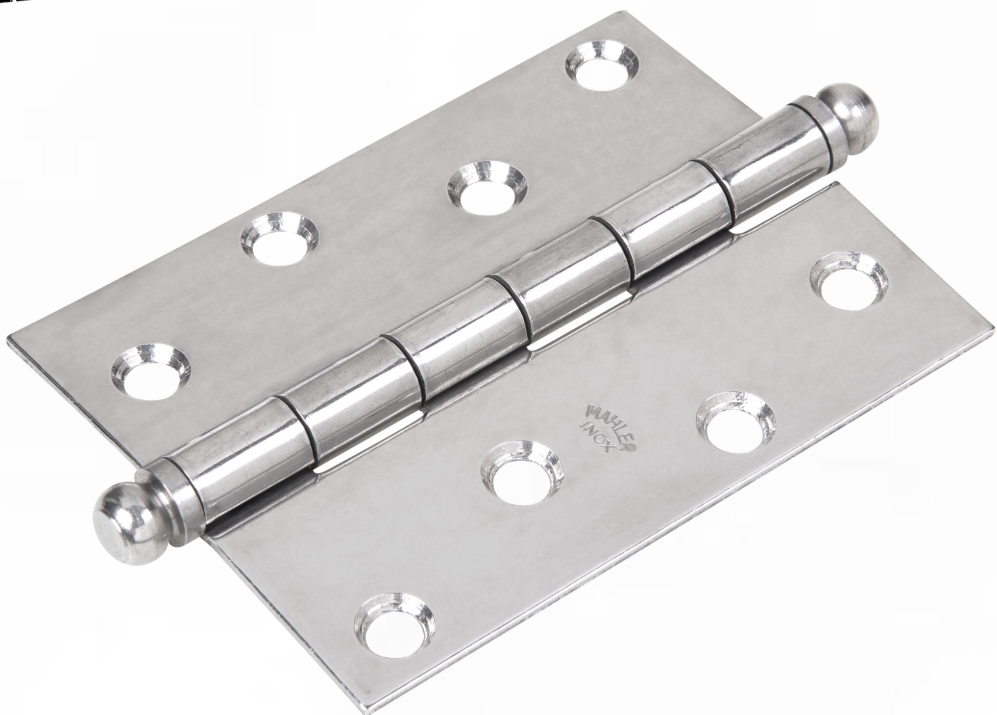
TIPOS DE ACABAMENTOS: